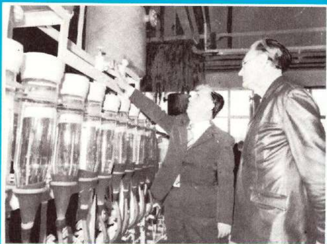
Horgászvezetők az üveges ikrakeltetést tanulmányozzák