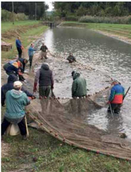
1. kép: Halászat Makádon alsó halágy

Az RDHSZ őszi haltelepítése 2021. október 4-én kezdődött (1. kép). Az előzetes tervek szerint 100 000 kg két-háromnyaras ráckevei pikkelyes ponty kitelepítéséről döntött az RDHSZ Elnöksége.