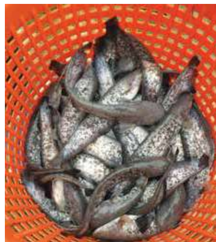
5. kép: Egynyaras harcsa