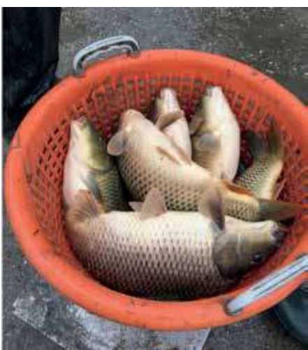
2. kép: 3 kg körüli ráckevei pikkelyes pontyok

A Makádi Tógazdaságban előállított halakat két egymástól elkülönülő ütemben helyeztük ki a horgászvizekbe. Az első telepítés 2021. október 4–8. között valósult meg. A 1–3. tavak lehalászatából 55 368 kg főleg háromnyaras ponty (2,5–3 kg-os átlagsúly) került ki (2. kép).