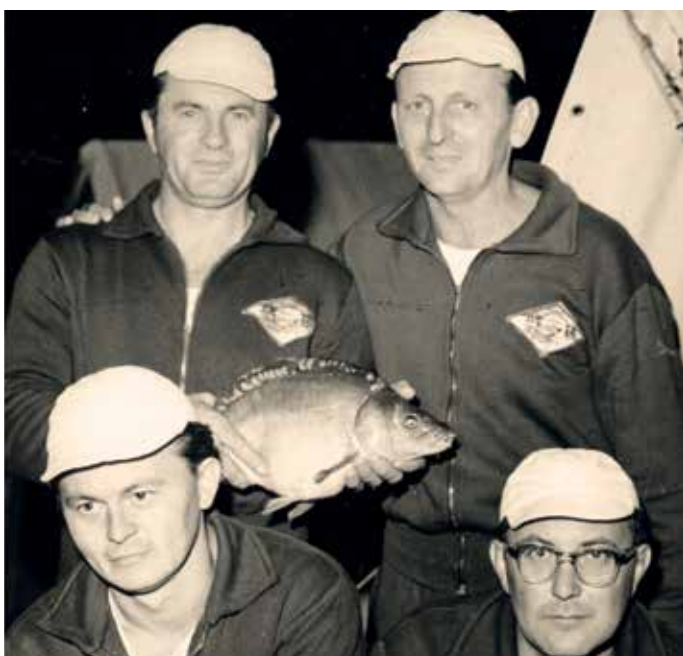
1965. Tihanyban megrendezett II. Országos Horgász Bajnokságon, csapat IV. hely

De milyen kezdet volt! Még az év tavaszán a háziverseny 3. helyezette, majd az IB versenyen második. Aztán jó helyezés az országos bajnokságon: