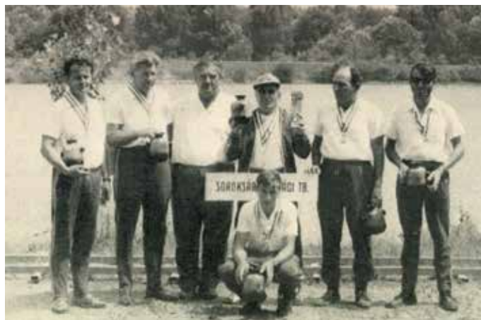
1977-ben a hatodik bajnokságot nyert, Soroksári Dunaági Területi Bizottság csapatában