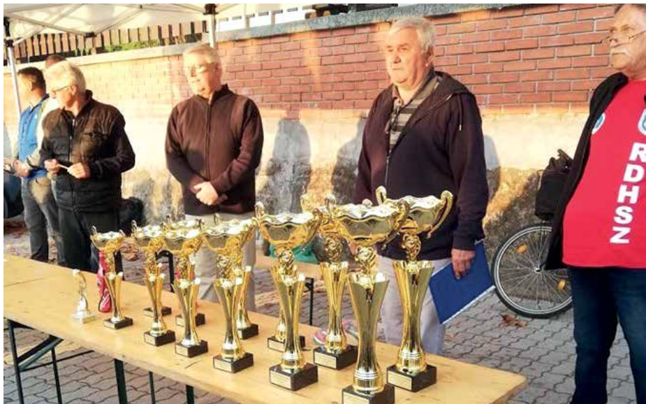
A verseny díjai átadás előtt

és a versenyt megnyitotta. A rajthelyek kisorsolása után a gyerekek elfoglalták a horgász helyeket, majd 8 órakor elkezdődött a verseny. A verseny közben lelkes segítőink szendvicssel és üdítővel látták el a rajthelyen a versenyzőket, csapatvezetőket. A halak is jöttek, ha nem is volt óriási kedvük a csalikra, az egész mezőnyből csak 5 gyermek nem fogott halat. 11 órakor a verseny végeztével megkezdődött a mérlegelés, kiértékelés, majd az összesítés. Az eredményhirdetéstkor a serlegeket, érmekeket, okleveleket és horgászbotokat a verseny védnöke adta át.