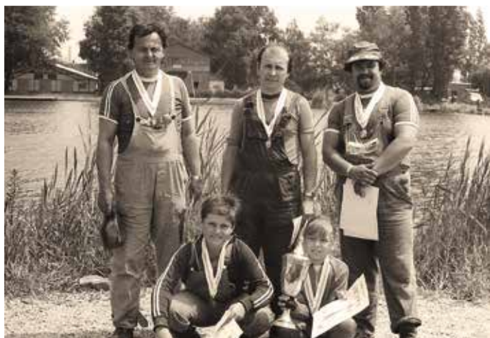
1980. Budapesti I.B. bajnokságot nyert, Csepel H.E. csapatában

Tanácsai kezdőknek és gyakorló horgászoknak. A kezdők mindig az apró halak fogásával próbálkozzanak, mert ez hozza meg legelőbb a sikerélményt, egyben sok tanulsággal is jár. Még a haladó, a gyakorló horgászok is tanulnak a versenyzőktől, hiszen a halfogó versenysport állandó, kényszerű fejlődésével a horgászat jelentős körének mintegy kísérleti „műhelye”.