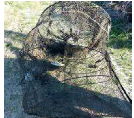
Örvendetes, hogy egyre kevesebb a halászeszközzel próbálkozó

esetben a súlyosabbik ügye kerül a fenti statisztikába. Az előző számunkban már jeleztük, de ismét örömmel kell jelentenünk, hogy a halgazdálkodási közbiztonság terén látványos javulás tapasztalható! 2020. január 01. és szeptember 30. közötti időszakban 391 fő ellen kellett halvédelmi-, vagy egyéb ügy miatt eljárást indítani Halőri