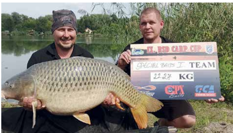
A verseny legnagyobb pontya: 22,27 kg (RSD CARP CUP rekord)