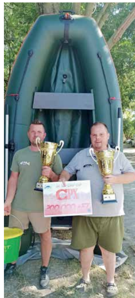
Összetett I. helyezett: F&R Baits TEAM (397,12 kg számított tömeg)

matos tájékoztatására. A reggeli, az esti, valamint a soron kívüli mérlegelésekről készült fotók, mérlegelés után azonnal, az eredmények, az összesítéseket követően szintén azonnal felkerülnek közösségi oldalakra. (Carpexpress TEAM Facebook-oldal, Amatőr Bojlisok Klubja Facebook-oldal.) A 42 csapat a 96 óra alatt összesen 1810,83 kg tömegű halat fogott (új rekord!). Ez 281 egyedet jelent (új rekord), 6,44 kg-os átlagtömeggel. A legnagyobb ponty 22,27 kg (új rekord), a legnagyobb amur 15,9 kg tömegű volt. A 42 csapatból mindössze 3 csapat nem tudott értékelhető fogást elérni. (A versenyszabályzat szerint kizárólag a 3000 gramm feletti pontyok és amurok kerültek mérlegelésre.)