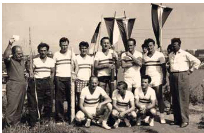
1969-ben Magyarország B-csapatában

A szakvezetők máris felfigyeltek a villámgyors kezű, ügyes fiatalemberre és meghívták a válogatott keretbe, sőt csapattag lett egy rangos nemzetközi versenyen, ahol tisztesen helytállt a „nagyok” között.