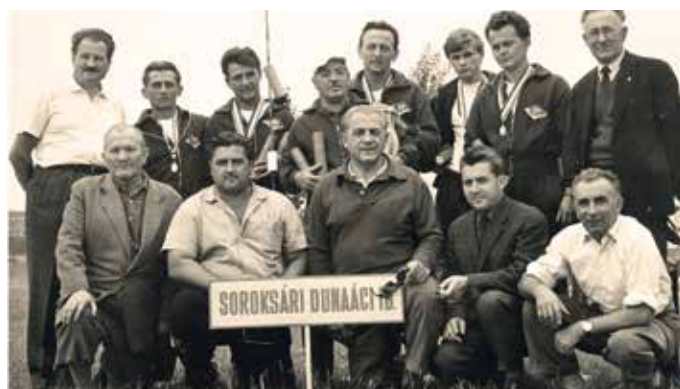
1970. Országos Bajnokságot nyert S.D.I.B. csapatában

A további eredmények már önmagukért beszélnek: nyolcszor nyert egyesületi s hatszor IB bajnokságot, pedig az élversenyzőket tömörítő egykori Soroksári Duna-ági I.B.-ben nem akármilyen szintet jelentett egyéni győztesnek lenni. Országos egyéni bajnokságot egyszer sem sikerült nyernie, de többszörös dobogósként jó néhányszor állt a győzelem kapujában. A snecizés és a kishalazás megszállottja volt és az is maradt, de abban szemfülességével, reflexzerű gyorsaságával igen magas szintet ért el. Egyéni rekordja 939 db sneci 1968-ban, a bajai Sugovicán három óra alatt. A hosszú teleszkópos és rakós botoknak egyaránt kitűnő kezelője.