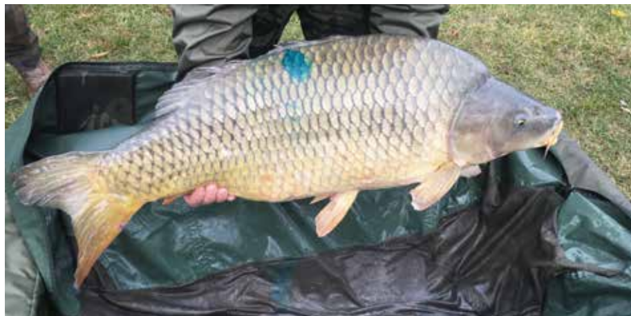
3. kép: 10 kg feletti telepítőanyag

A telepítés második ütemére 2021. október 20–22. között került sor. A legnagyobb, 6. sz. tavunkból 48 115 kg