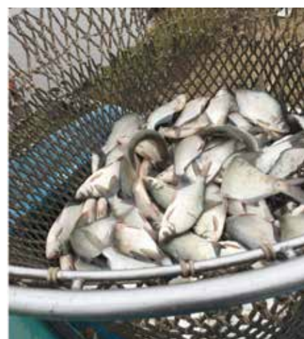
4. kép: Kétnyaras dévérkeszeg

(Cikk kéziratának lezárása: 2021. 11. 04.)