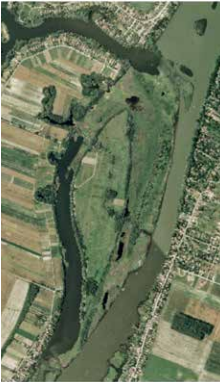
Csupics szigeti úszóláp

A Duna ágon a legszebb úszólápos területek Szigetszentmiklós- Dunaharaszti - Taksony térségében, valamint Szigetcsépen Csupics-szigeten és környezetében található.