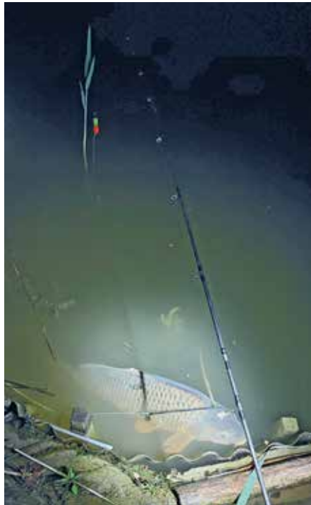
Ezt a halat sem fogják ellopni vizünkéből...

Ismételten megjegyezzük, hogy a legtöbb esetben halmazat is felmerül (pl. jogosulatlan horgász méret alatti halat visz el vagy az orvhalász védett halat fog ki). Ez