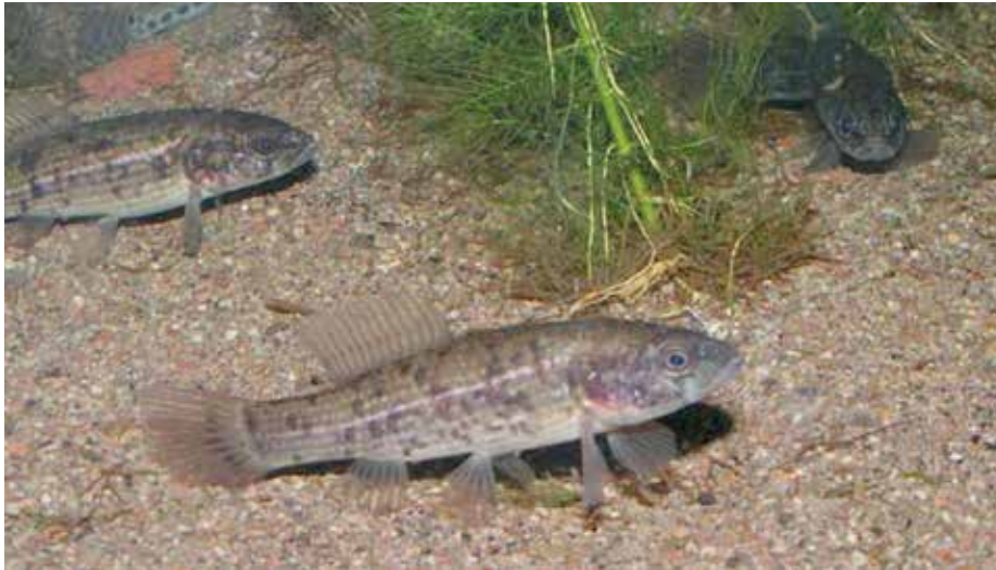
Lápi póc

A Natura 2000 terület jelölő fajai, amelyek úszólápokon előfordulhatnak: vöröshasú unka, mocsári teknős, szivárványos ökle, ragadozó őn, réti csík, közönséges denevér. Fokozott védelem alatt álnak a jelölő fajok közül: lápi póc, vidra, hagymaburok.