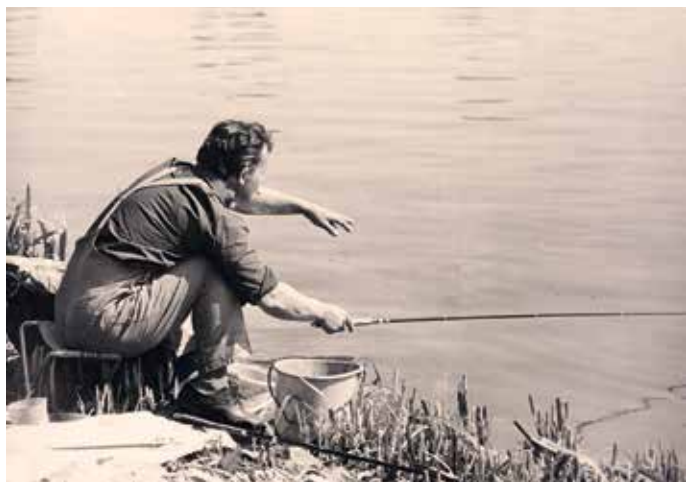
1980. Csepel H.E. versenyén 645 darab snecit fogott

Keszegre etetési gyakorlata általában a következő volt: 10–15 méterről kezdve etetőgombócok sorozata vonalban egyre kifelé, majd a fenékmérésekkel betájolt „nyero” sávban keresztirányú szórás, vagyis a hétköznapi horgászok körében hírhedt „záróetesés”. Ezzel ugyanis lezárta a vonuló halrajok útját.