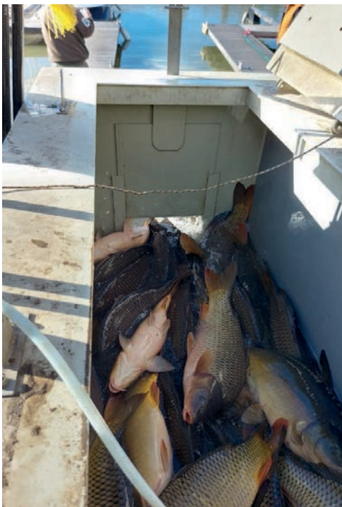
MOHOSZ támogatásból megvalósított extra méretű ponty telepítése