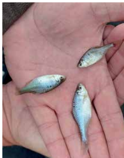
Óvd az öklét! Védett hal, nem csalihal!