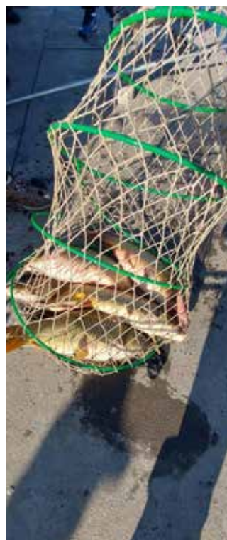
A besokallás tipikus esete

a sok hasznos információt, mellyel munkánkat segítik! Kérjük, a továbbiakban is jelezzék, ha nem odailót látnak-tapasztalnak szerezett vízterületünkön! A bejelentéseket diszkréten kezeljük.