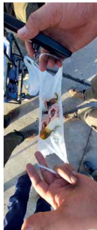
Darabolva kis helyen is elfér... Rosszul gondolta!