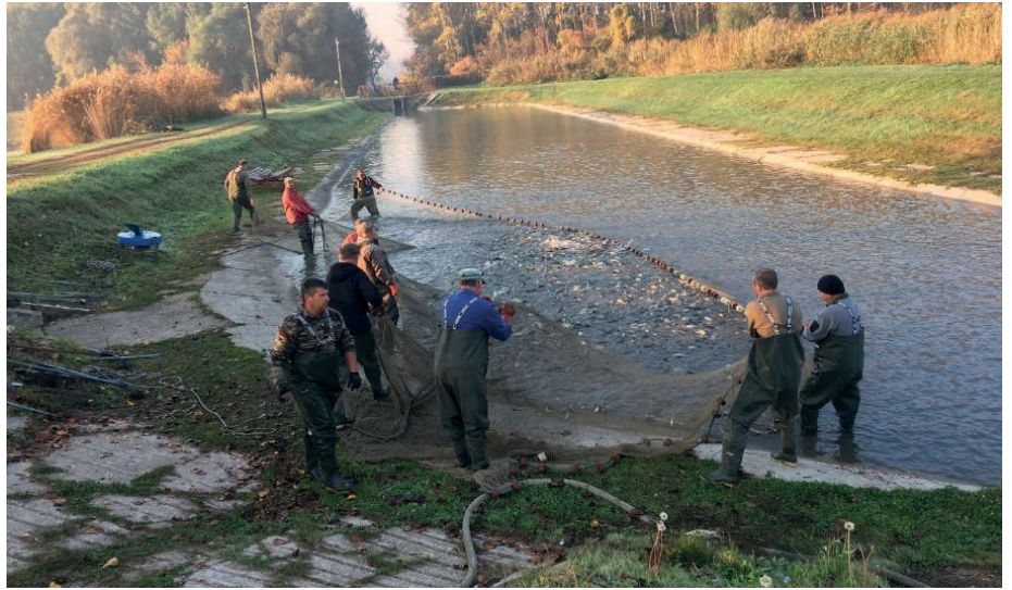
Lehalászat a Makádi Tógazdaságban 2023 őszén

Az RDHSZ 2023. évi haltelepítési terve eredetileg 150 tonna ponty telepítését tartalmazta. A tavaszi haltelepítéseink rendben lezajlottak, a pontyok döntő többsége (28 129 kg) a Dömsödi Tógazdaságunkból származott, a kisebb része (3971 kg) pedig a Makádi Tógazdaságból. 2023 tavaszán 32 100 kg ponty került a horgászvizeinkbe. A 2023. nyári haltelepítés is a terveink szerint alakult, azt kis mértékben túllépve 10 549 kg horogérett ponty telepítésével zárult. A tavaszi-nyári haltelepítés összesen tehát 42 649 kg mennyiségű volt, ami plusz 2649 kg túlteljesítést jelent. Az őszi haltelepítéseink 2023. október 16-án kezdődtek el. Az RDHSZ Elnöksége az eredetileg tervezett őszi 110 tonna telepítését 120 tonnára módosította, ezáltal az éves haltelepítési terv 160 tonnára módosult. Később, a bőséges halkészlet és az értékesítés hiányában az Elnökség az őszi haltelepítési tervet még tovább emelte, azaz a Makádon előállított, 120 tonnán felüli teljes halállomány horgászvizeinkbe történő telepítéséről is döntött. Végül igazán kiemelkedő haltelepítési