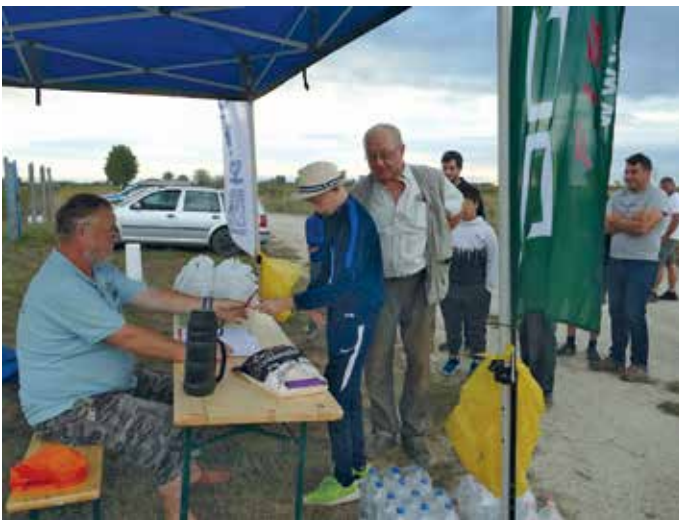
Regisztráció a versenyen