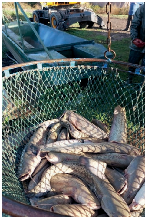
A ragadozóhal telepítésünket is fokoztuk 2023-ban