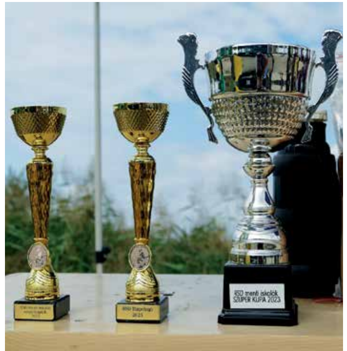
A két verseny serlegei

Ezzel egyidőben a vízterület elején az RSD menti iskolák szuperdöntője került megrendezésre. A csapatversenyt a Szigetszentmártoni Általános Iskola csapata nyerte 6640 gramm fogással. Második helyezést ért el a Szigetszentmiklósi József Attila Általános Iskola 3350 grammal. Gratulálunk a nyerteseknek!