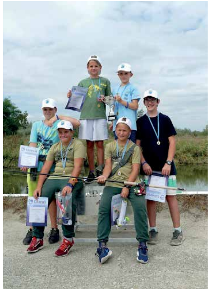
Általános iskolások a dobogón