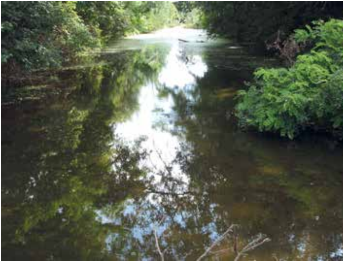
A feltöltődött mellékág