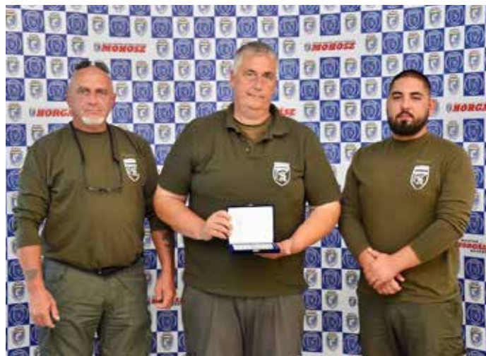
A 2023. évi országos 4. helyezett RDHSZ hivatásos halóri csapat