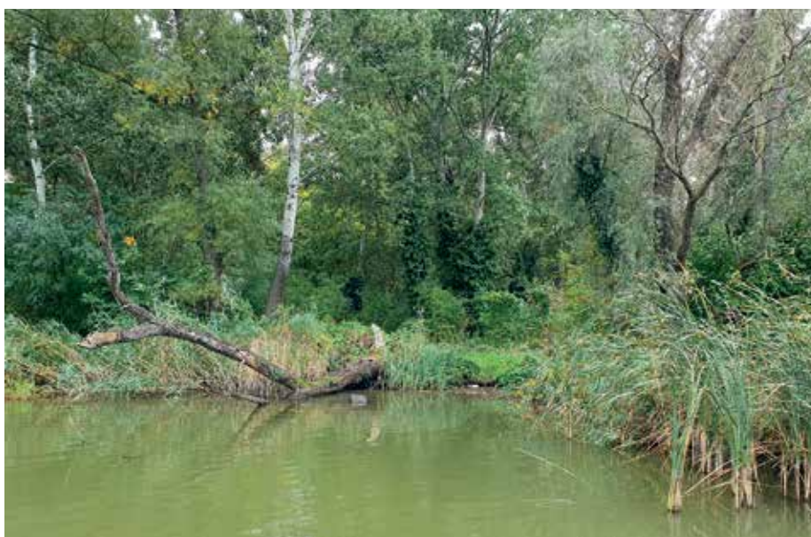
Bedőlt fa a sziget alsó végénél

Domori-szigetként is emlegették. A régi térképeken vagy erdős, vagy nádas-bozótos földdarabként ábrázolják.