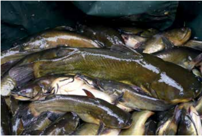
Egy kupás törpe a terítéken