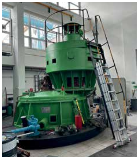
A projekt keretében felújított reverzibilis turbina