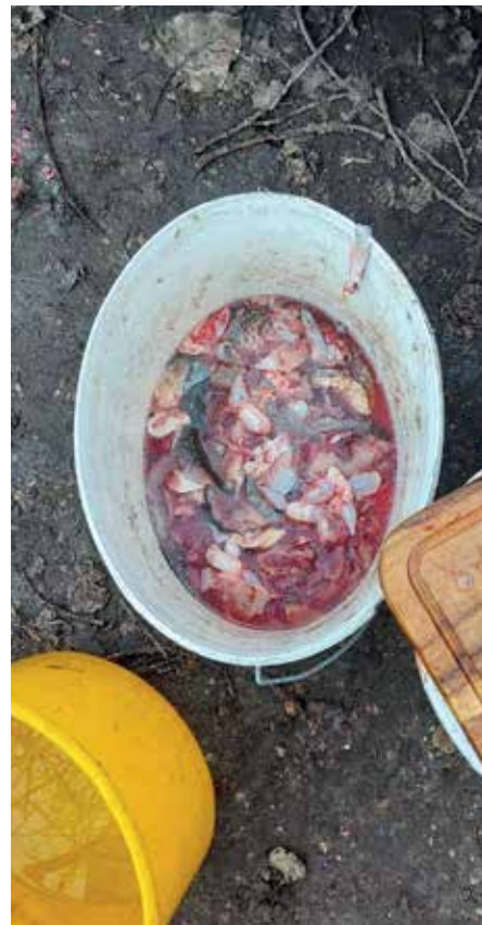
A mészárszék mellékterméke

A halgazdálkodási hatóságtól jelentős pénzbírságra (százazres nagyságrendű) és huzamosabb (6–9 hónap) idejű eltiltásra számíthat. Ilyen súlyú és kiemelten horgász-közösség-ellenes magatartásra a halgazdálkodási jogosult hatáskörében eljárva 1–5 év közötti saját vízterületről történő eltiltást alkalmazhat és fog is. Ezen kicsiny pontyok rövidke vadvízi élete most véget ért. Néhány napot tudtak csak eltölteni kihelyezés után az új otthonukban a Ráckevei Duna-ágban. Épp, hogy csak fel tudták fedezni az élővíz varázsát, a vadvíz ízét, táplálékosságát. Ők már nem tudnak beilleszkedni a RSD